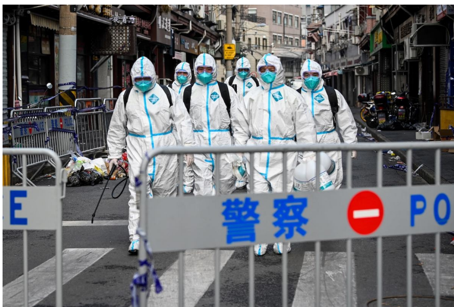
Quartier bouclé pour une désinfection à Shanghai, après la détection de plusieurs cas de Covid-19, en janvier 2021

Les applis de traçage sont “le prix à payer pour retrouver une liberté” face au virus et un semblant de vie normale, estime l'un de mes amis chinois. Et c'est aussi “un geste simple pour se protéger” , m'explique-t-il. Sur le plan sanitaire, ce système a indéniablement fait ses preuves. A chaque apparition du virus, il permet d'identifier rapidement les cas contacts et d'isoler si nécessaire un quartier ou un immeuble spécifique.