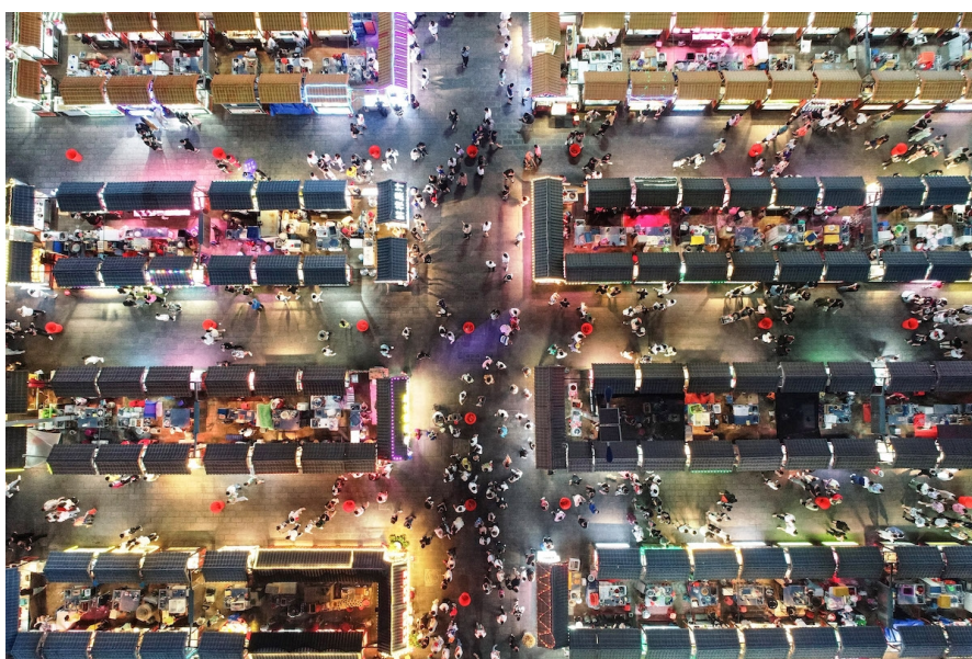
Marché de nuit à Shenyang, dans la province de Liaoning, le 16 juin 2020

Dans l'un des pays les plus connectés au monde et où les questions de vie privée autour des données rencontrent peu d'intérêt, les géants du web et les opérateurs téléphoniques n'ont aucun mal à suivre à la trace les déplacements des Chinois.